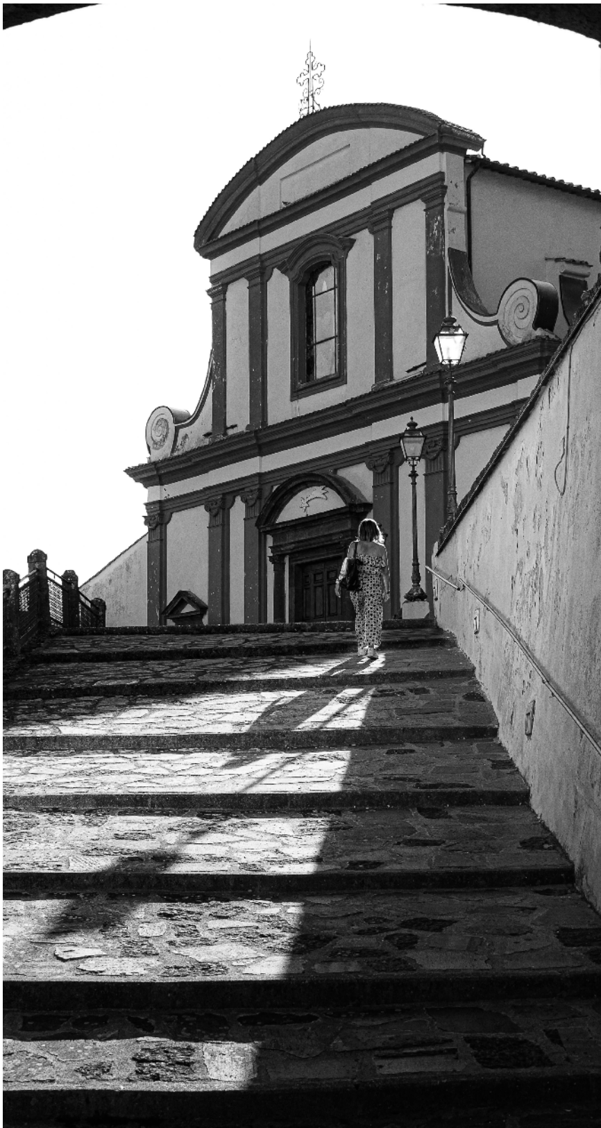
Evaldo Cipolloni Convergenza farnesiana ( Gradoli )